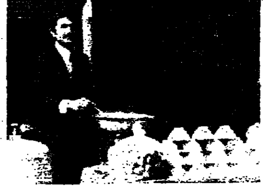
بائع السحب يتنظر زبخته

زحلة - من مراسل «الانوار» : الزحل الذي كان مرادفا لتاريخ شهورنا .. وغادها خلال الاحداث ، بدأ يعود الى الرواحه الخضراء ..